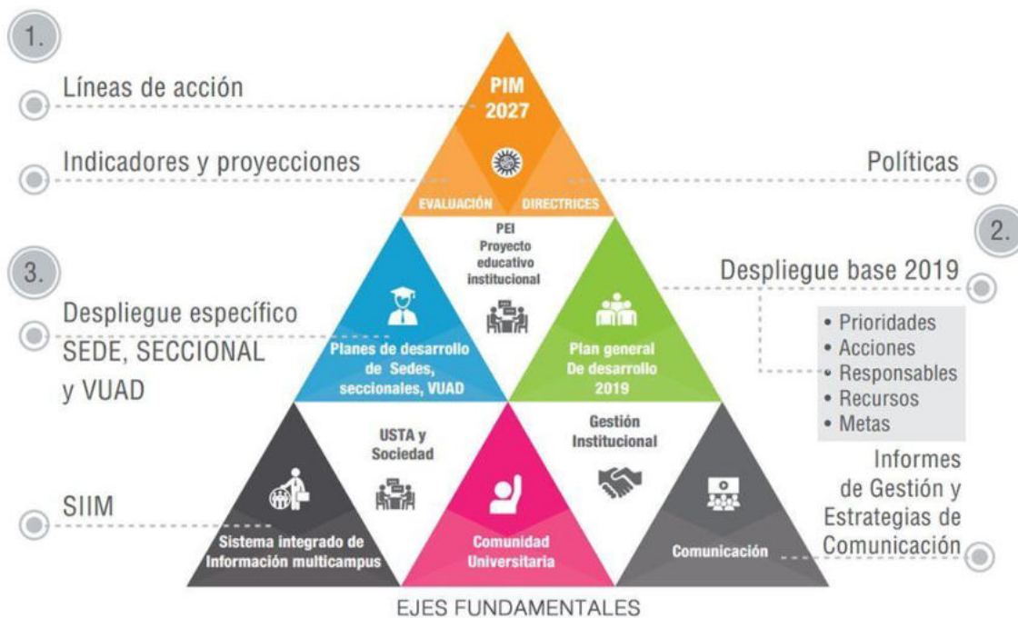
Ilustración 4: Modelo de planeación USTA Colombia 2016-2017

Fuente: Documento síntesis Plan Integral Multicampus 2016-2027 y Plan General de Desarrollo 2016-2019