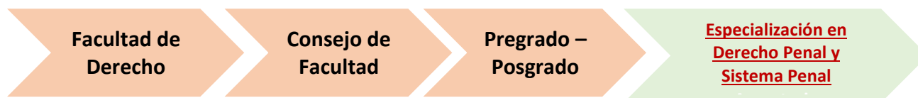
Ilustración 3: Organización facultad de Derecho